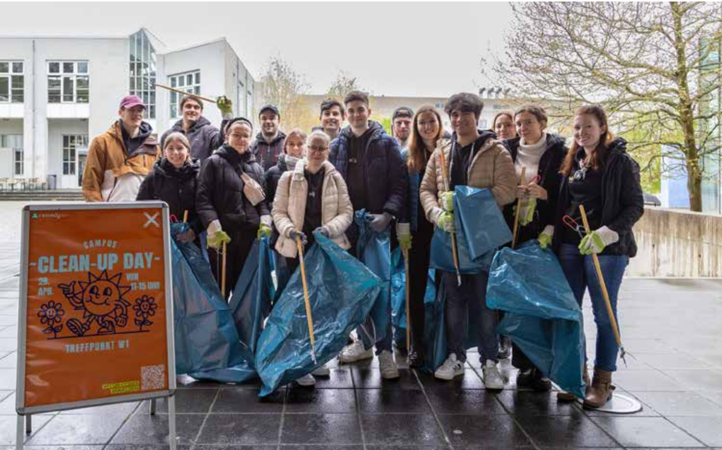
Garbage collection campaign in April