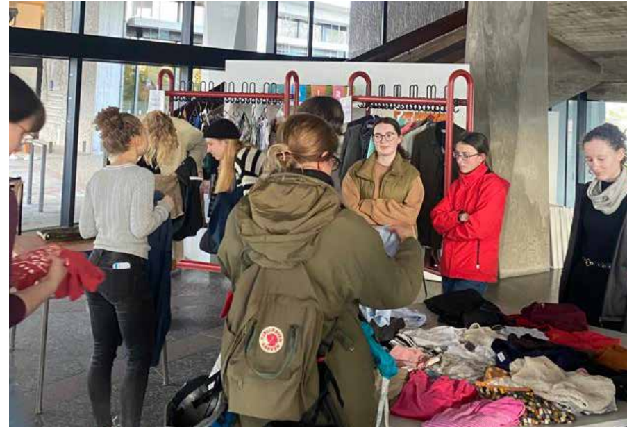
Clothing flea market