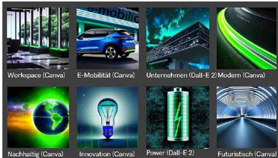
KI-Moodboard e-mobilio.