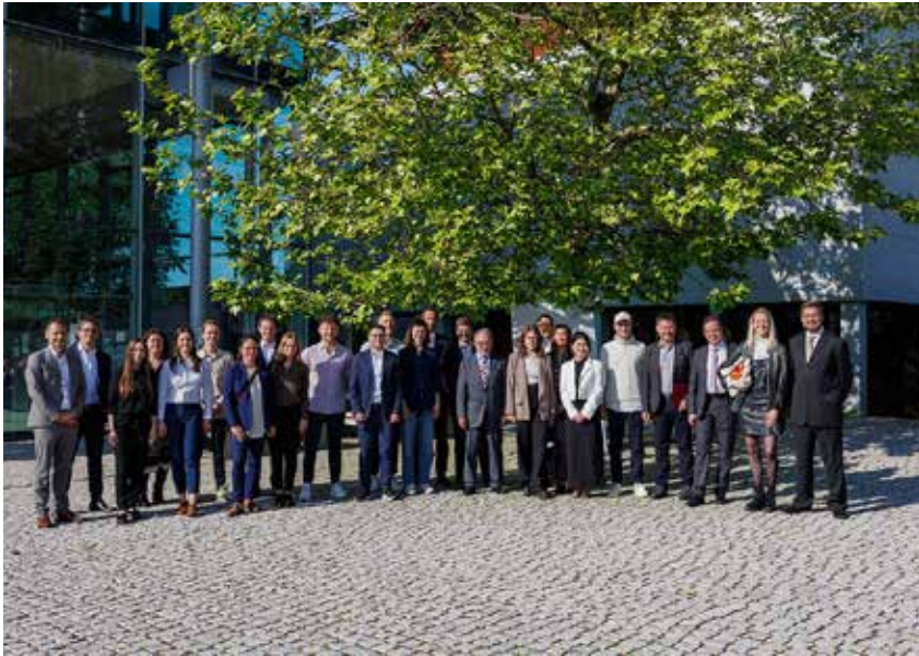
Die Preisträgerinnen und Preisträger der Hochschule Pforzheim freuen sich über die Auszeichnungen ihrer Arbeiten durch die zahlreichen Unternehmen und Institutionen.

von Susanne Materac, Referentin Presse- und Öffentlichkeitsarbeit