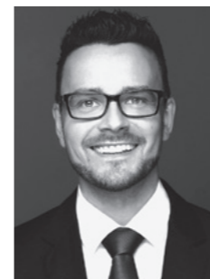
Peter Boch Oberbürgermeister der Stadt Pforzheim

In diesem Sinne wünsche ich uns eine ereignisreiche und spannende Nacht, in der wir viel Neues lernen dürfen und die wir nie wieder vergessen.