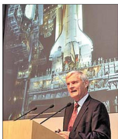
Unterwegs mit dem Space Shuttle: Ernst Messerschmid.

Wann hat man schon mal jemand vor sich, der eine Reise ins Weltall hinter sich hat? Sehr selten wahrscheinlich. Am Mittwochabend kamen all diejenigen in diesen Genuss, die das letzte Studium generale in diesem Jahr besucht haben. Professor Ernst Messerschmid von der Universität Stuttgart flog 1985 mit der Challenger-Rakete in den Weltraum. Eine Woche lang schwebte er über den Dingen. Bei seinem Vortrag „Vom All in den Alltag“ zeigte er, wie wichtig es ist, dass die Forschung im Weltraum betrieben wird. „Dort oben können wir Tests vornehmen, die hier unten auf der Erde gar nicht möglich sind.“ Zum Beispiel En-