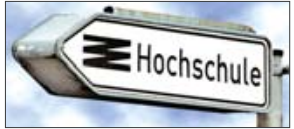
Was läuft auf dem Campus? Einmal wöchentlich berichtet die PZ während des Semesters über Wissenswertes von der Hochschule.