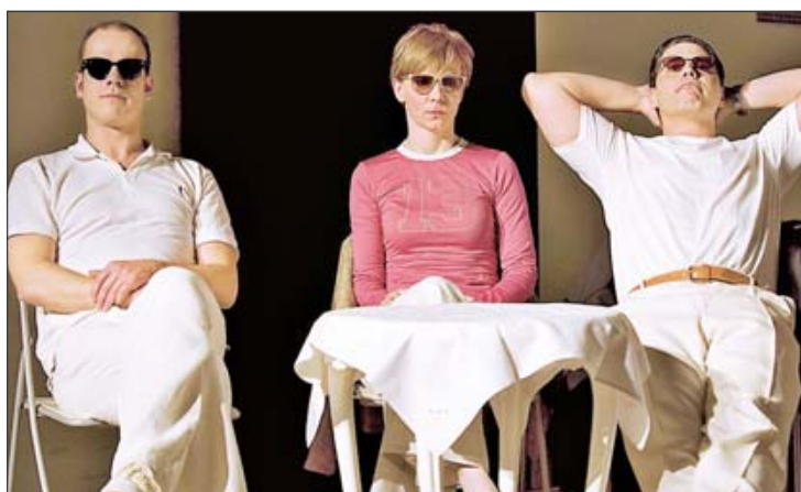
Um Klischees rund um das Thema Liebesbeziehungen geht es in dem Theaterstück „Wie es so läuft“.

i Karten für „Wie es so läuft“ gibt es zum Preis von 7,70 Euro (ermäßigt 4 Euro) an der Theaterkasse. Eine weitere Vorstellung findet am Dienstag, 19. Januar, um 20 Uhr, im Foyer statt.