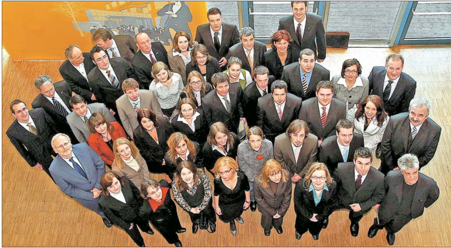
Geben und nehmen: Jahr für Jahr zeigen Unternehmen und Organisationen, wie wichtig ihnen die Hochschule Pforzheim ist – unter anderem durch die Verleihung von Förderpreisen. Den Stiftern kommt dabei auch die Rolle des Motivators zu.