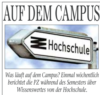
Was läuft auf dem Campus? Einmal wöchentlich berichtet die PZ während des Semesters über Wissenswertes von der Hochschule.