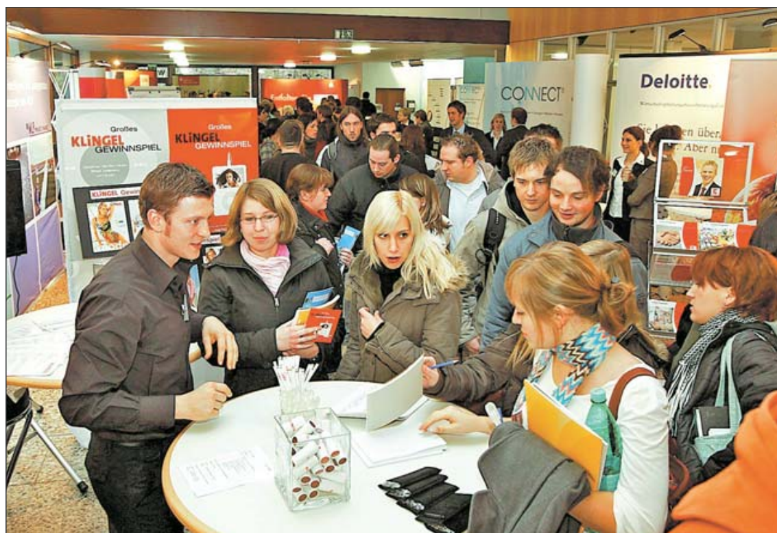
Ob Klügel, Witzenmann oder Blanco – Unternehmen aus der Region buhlen ebenso wie internationale Firmen, um die besten Betriebswirte und Ingenieure.