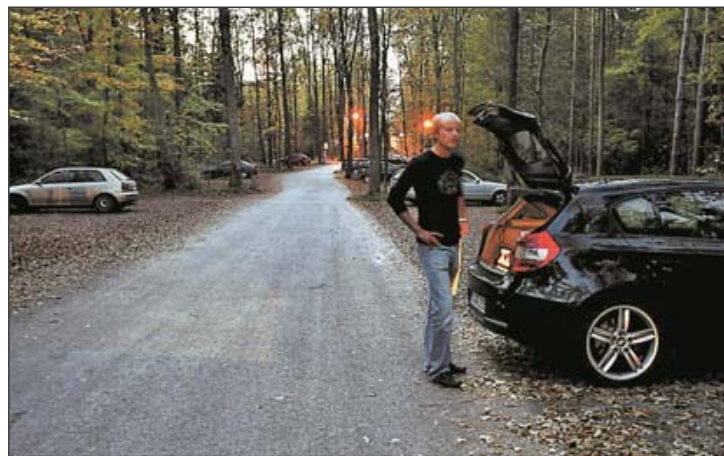
Der südliche Teil des Parkplatzes gegenüber des Wildparks ist gar nicht beleuchtet – und der nördliche nur bis 20.30 Uhr.

Zumindest was die über 300 hochschuleigenen Parkplätze unterhalb der Bibliothek angeht, können Frauen seit Semesterbeginn aufatmen. 28 Stellflächen sind auf der obersten Ebene aus Frauenparkplätze ausge-