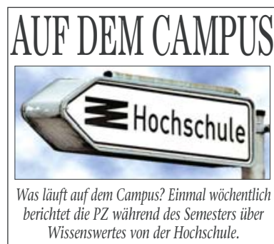
Was läuft auf dem Campus? Einmal wöchentlich berichtet die PZ während des Semesters über Wissenswertes von der Hochschule.

Was ihn so optimistisch macht, welche Forderungen er aufstellt, Schlüsse zieht und Beispiele nennt,